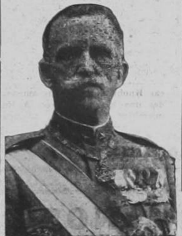
SU MAJESTAD VICTOR MANUEL III REY DE ITALIA Y EMPERADOR DE ETIOPIA

Con grandes manifestaciones de júbilo festeja hoy Italia, su Día Nacional, 11 de Noviembre fecha